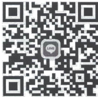
กลุ่มไลน์ประสานงานหนังสือเล่มเล็ก

ขอให้ครูที่ปรึกษาหนังสือเล่มเล็ก เข้าร่วมกลุ่มไลน์ตาม QR Code ที่ปรากฏด้านล่างนี้ เพื่อความสะดวกในการติดต่อ ประสานงานต่อไป