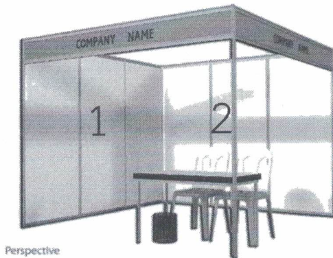
ภาพบูธที่อยู่มุมแถว

ภาพ (ร่าง) โครงสร้างนิทรรศการที่สำนักงานคณะกรรมการการศึกษาขั้นพื้นฐานได้จัดเตรียมไว้